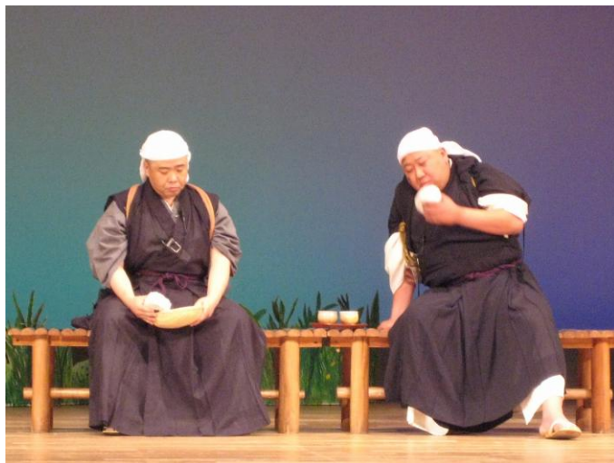
第一幕 庫院での様子

に盛り上がり、大きな笑いの渦と化していました。後半はスクリーンを使って医学の面から笑いが病気にどういった良い影響を与えるのかなど、グラフで具体的なデータを示されながらご講演いただきましたが、こちらのほうでも客席はとても明るい雰囲気になり満ち満ちて参加者のみなさんはとても楽しんでいらっしやいました。