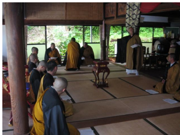
配役・本則行茶の様子

なのかといったことをご教授いただきました。県内でこれから晋山式が多く予定されていることもあり、非常に有意義で実用的な月例研修となりました。