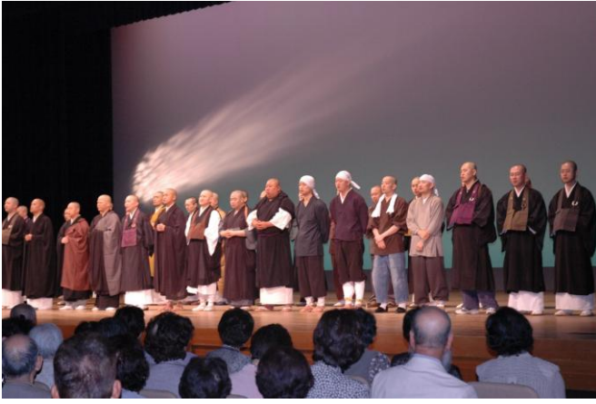
最後に全員で「まごころに生きる」を奉詠